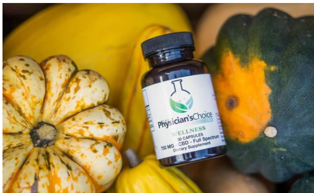
The Physician's Choice CBD wurde 2018 gegründet und hat bereits neun CBD-Produkte entwickelt, die sich bei Entzündungen und Schmerzen eignen. Zudem gibt es auch Schlaf- und Wellnesspräparate.